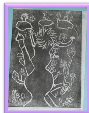
4年 0000 「とげとげした花」