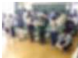
5年1組 1年をふり返る発表会