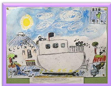
1年 0000 「さどがしまでタカラコガネを見つける」