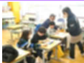
くんぐん 漢字を使った言葉探し

保護者・ご家族の皆様には、この1年、PTA活動や学校行事等の教育活動にたくさんのご協力をいただきました。改めて感謝申し上げます。