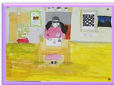
3年 0000 「画家」