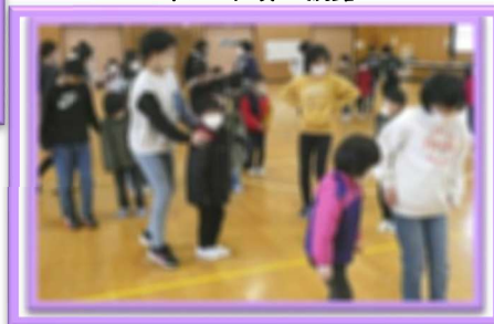
5年生 ジェンカのステップをやさしく指導