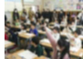
2年1組 図に表し式を考える