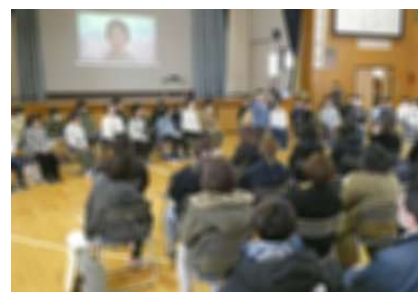
6年1組 家族に感謝する会