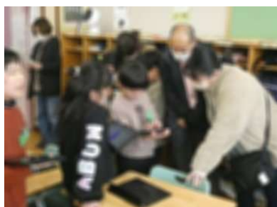
3年1・2組 What's this?クイズ