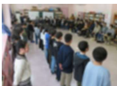
4年1・2組 十歳おめでとうの会