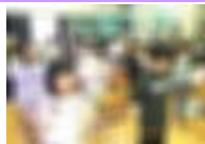
1年1組 歌と合奏の発表