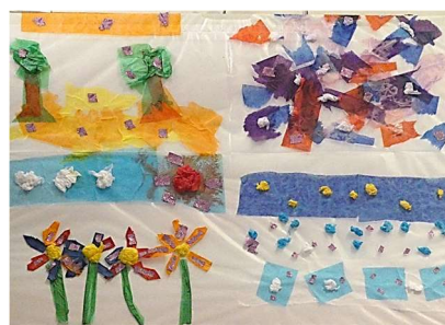
「春夏秋冬」 2年 ○○○○