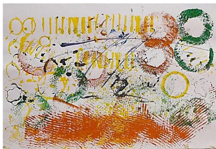
「いろいろなかたち」 1年 ○○○○