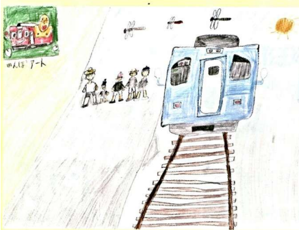
「初めての内陸線」 優秀賞

CGC全国児童画コンクールで本校の3名が受賞しました。おめでとうございます。出品した43名には参加賞がありますので、来週お届けします。