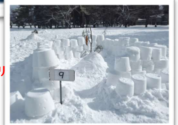
アート金賞:9班 「ピラミット建設中」