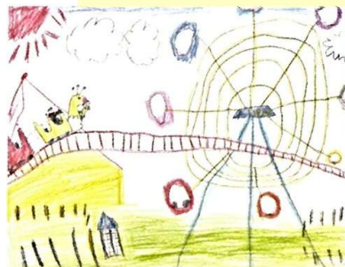
「楽しかった遊園地」 入賞