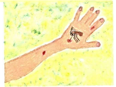
「蚊にさされた」 入賞