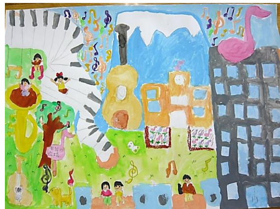
「音楽のまち」 5年 ○○○○ 自然に音楽が聞こえてくるまちをイメージして描きました。