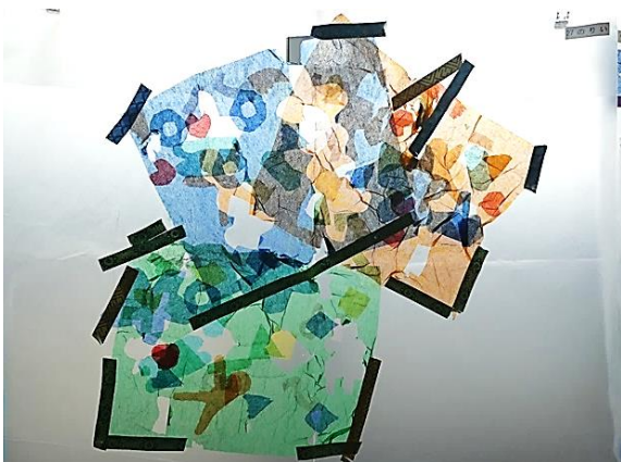
「いろいろな島」 2年 ○○○○ お花紙をいろいろな形に切って、それを組み合わせて島を作りました。