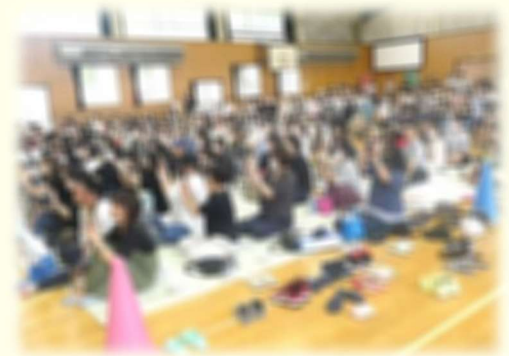
たくさんの拍手が何よりのプレゼント ご来校、ありがとうございました。

この経験を今後の生活に生かし、一人一人のさらなる成長に向けて支援してまいります。今後とも子どもたちへの温かい励ましをお願いいたします。