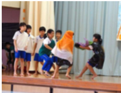
3年生 「ちょっとふしぎな三年とうげ」