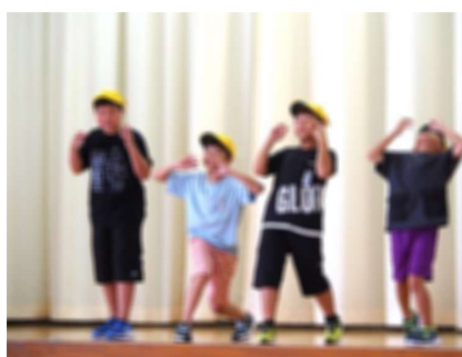
4年生 「10歳おめでとう」