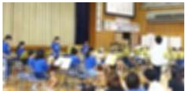
ジュニアバンド部の演奏