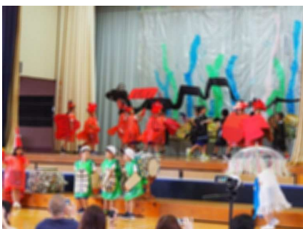
2年生 「スイミーとゆかいなトライのなかまたち」