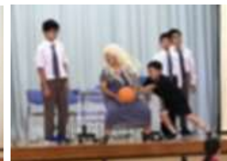
6年生 「怪盗 キャッツ・アイアイ」