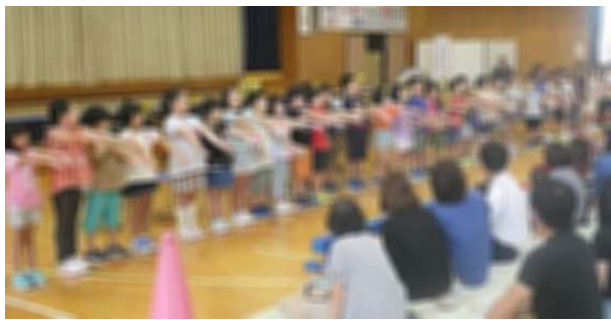
1年生 「はじめのあいさつ」 めんこい!