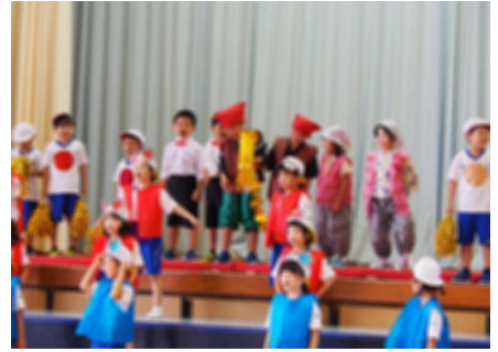
1年生 「おむすびころりん」