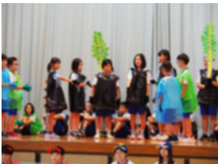
5年生 「ひかりのふるさと」