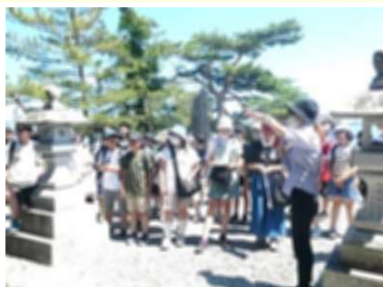
松島:五大堂を見学