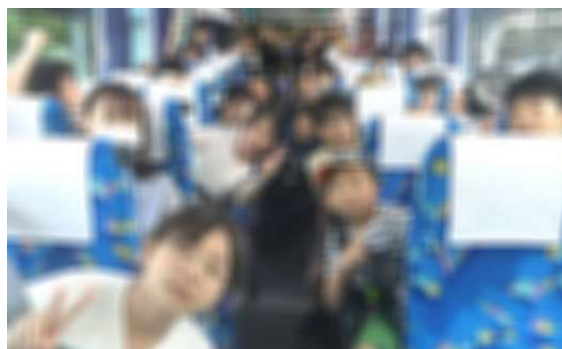
「行き笑顔 帰り寝顔の バスの旅」