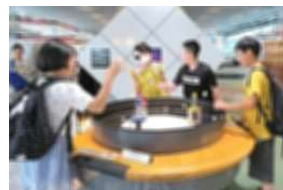
ワクワク・ドキドキの科学館