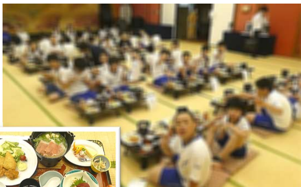
ホテルでの夕食: 大広間での豪華なお膳