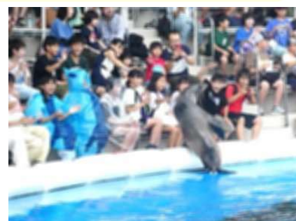
うみの杜水族館:目の前のアシカに大興奮