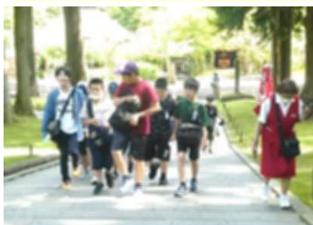
中尊寺:青葉の境内を巡る

仙台市科学館(体験) = 青葉城址(見学・昼食) = ベニーランド(遊園・買い物) = 学校着(18:25)