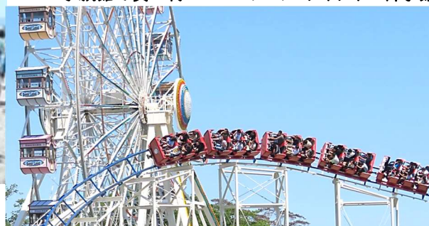
絶叫、歓声、笑顔のベニーランド