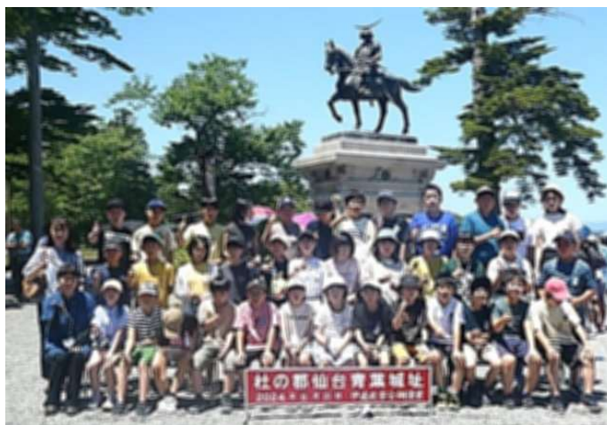
青葉城址:青空と「伊達正宗像」を背に記念撮影