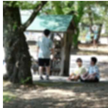
日陰でくつろぐ6年生