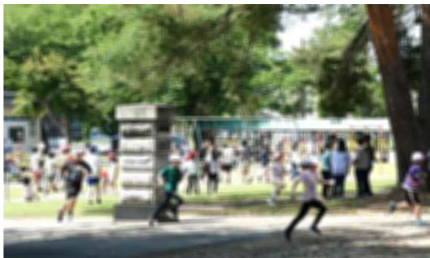
大人気の鬼ごっこ

23日(木)は、昼休みの時間を延長して子どもたちがたっぷり遊べる日、「たっぷり遊ぼうDAY」でした。普段の日課では昼休みの後は掃除の時間ですが、この日は掃除の時間も昼休みにして、子どもたちが遊べる時間を確保したものです。この日の昼休みは全校が校庭、グラウンドで思い思いに過ごしました。校庭には子どもたちの元気な歓声が響きました。