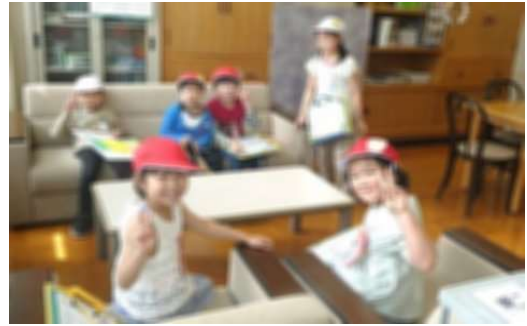
ソファの座り心地を確かめる探検隊

今日24日(水)、1年生と2年生の学校探検がありました。この学習は、2年生が1年生に進んで関わり、学校を知ってもらおうというものです。1年生は2年生に案内され、クイズを解きながら、特別教室を中心に巡りました。探検隊は、校長室にも訪問してくれました。「校長室に、いすは何個ありますか」というクイズの答えを実際に数えて確かめました。答えは10脚です。保護者の皆様もグループで校長室を訪問されませんか。大歓迎です。