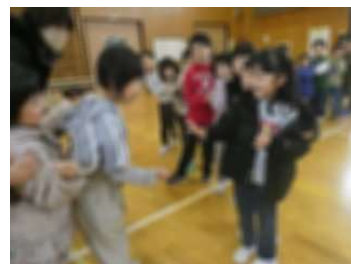
じゃんけん列車ゲーム

12月7日(木)、1年生がなかよし園の年長児を学校に招待し、交流しました。1年生は校庭などで採取した松かさやドングリなどを使った遊びを考え、7つのコーナーで園児を楽しませてくれました。「いらしゃい、楽しいよ。」と自分のコーナーに呼び込み、園児がうまくいけば自分のことのように喜ぶ姿に、うれしい成長が見られました。