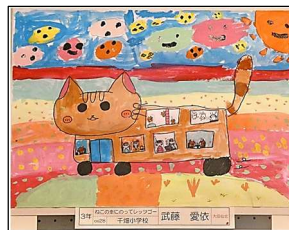
3年 ○○○○ 「ねこの車にのって レッツゴー」