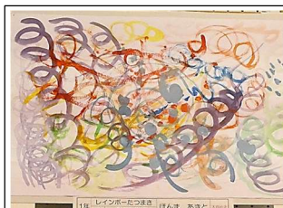
1年 ○○○○ 「レインボーたつまき」

1年 ○○○○ 1年 ○○○○ 2年 ○○○○ 2年 ○○○○ 3年 ○○○○ 3年 ○○○○ 4年 ○○○○ 4年 ○○○○ 5年 ○○○○ 5年 ○○○○ 6年 ○○○○ 6年 ○○○○