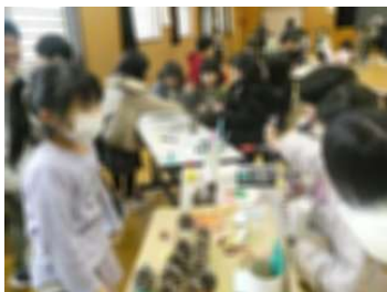
おみやげやさん、大繁盛!

12月7日(木)、1年生がなかよし園の年長児を学校に招待し、交流しました。1年生は校庭などで採取した松かさやドングリなどを使った遊びを考え、7つのコーナーで園児を楽しませてくれました。「いらしゃい、楽しいよ。」と自分のコーナーに呼び込み、園児がうまくいけば自分のことのように喜ぶ姿に、うれしい成長が見られました。