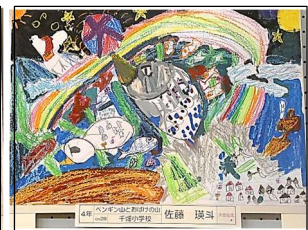
4年 ○○○○ 「ペンギン山とおばけ の山」