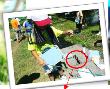
見事、ザリガニを釣り上げました