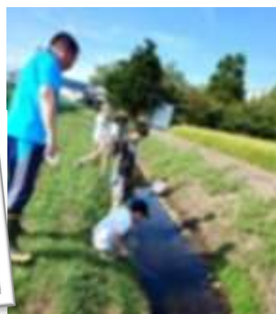
ふるさと自然体験クラブのようす

8月29日（火）、「5年生」と「ふるさと&自然体験クラブ」の子どもたちが、野際清水でザリガニの駆除活動を行いました。