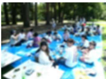
校庭での野菜パーティー