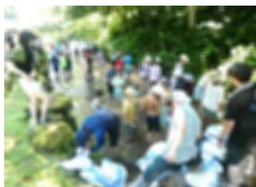
せせらぎ公園での魚のつかみ捕り

1日目:歓迎会、ラベンダー園見学、夕食会・花火 宿泊:ワクアス 2日目:魚つかみ捕り体験、ホストファミリーとふるさと村で活動 3日目:清水巡り、校庭での野菜パーティー