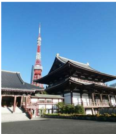
上:増上寺と東京タワー