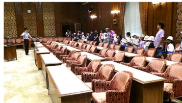
国会議事堂の特別会議室を見学