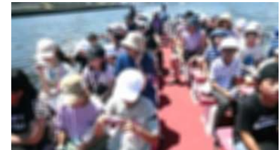
船から東京を見学