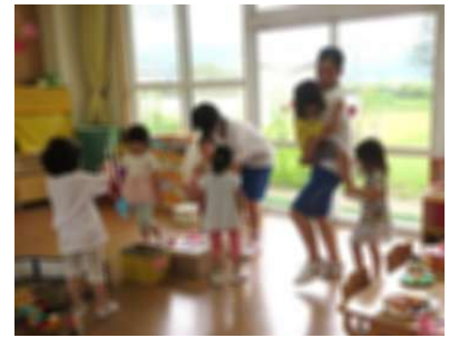
保育体験(なかよし園)

7月26日、町教育委員会主催の職場体験活動「ミズモの郷キャリアスクール」が行われ、5・6年生の子どもたちが参加しました。当日は各自が希望した企業・事業所に分かれて、体験活動を行いました。活動を通して、働くことの楽しさや大変さなどを学ぶことができました。