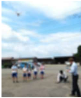
ドローンを操縦(はりま建設)

7月26日、町教育委員会主催の職場体験活動「ミズモの郷キャリアスクール」が行われ、5・6年生の子どもたちが参加しました。当日は各自が希望した企業・事業所に分かれて、体験活動を行いました。活動を通して、働くことの楽しさや大変さなどを学ぶことができました。