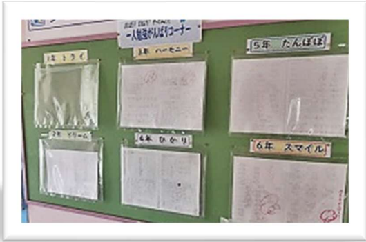
一人勉強がんばりコーナー

家庭学習の時間 千畑小学校では、 「学「年×10分+10分」以上」 の家庭学習を推奨しています。