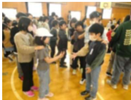
全校でのじゃんけん列車ゲーム