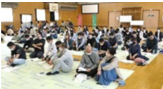
4年ぶりに開催されたPTA総会