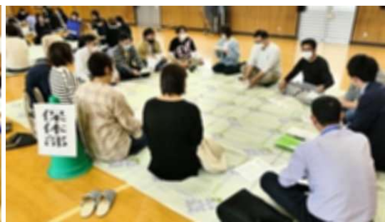
専門部会の話し合い