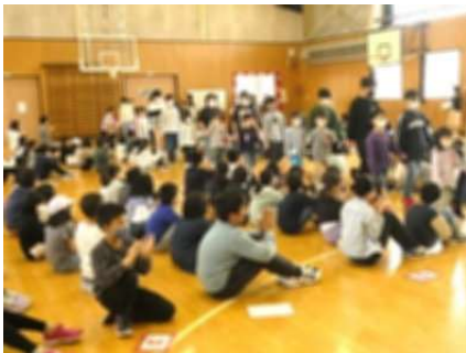
1年生と6年生が手をつないで入場

1年生が入学して10日あまりとなりました。21日（金）は、「1年生を迎える会」を行い、1年生を囲み全校でゲームを楽しみました。また、この会を通して「縦割りグループ活動」も始まりました。縦割りグループは24グループあり、1年生から6年生までの異学年で編成されています。これからは、6年生がリーダーとなり、グループで掃除をしたり、学校行事や集会と一緒に活動したりしていきます。学年が異なる子どもたちが協力して活動することを通して、相手を思いやる心や責任感などを育てていきます。