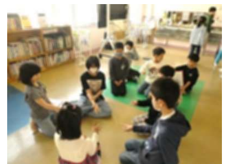
縦割りグループでのゲーム