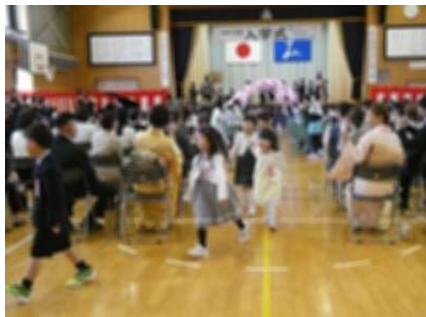
練習なしの入退場でしたが、立派にできました。