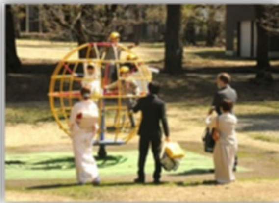
入学式を終え、校庭の遊具で楽しむ1年生。これからも仲良く元気に遊んでくださいね。