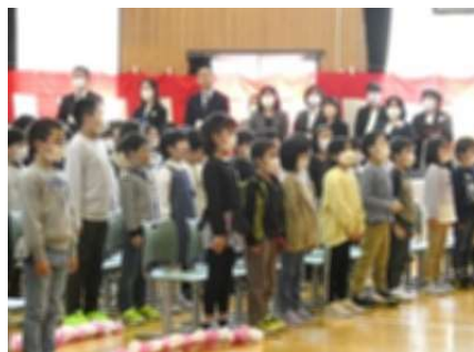
心をこめて新入生をお迎えした在校生。