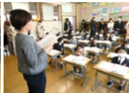
初めての学級での活動。教室はびっしりです。