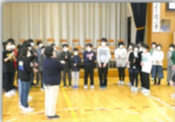
新任式・始業式、入学式などの準備で大活躍の6年生。千畑小の頼もしい機関車です。