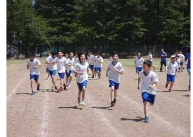
かけ足運動スタート（10日）

6月も後半となりました。秋田県も梅雨入りし、雨模様の日が多くなってきました。また、気温も高くなってきましたので、熱中症への配慮も必要です。学校では、教室に設置しているエアコンを状況に応じて稼働させています。マスクが暑く感じられるようになりましたので、屋外にいるときや運動時、密にならないところでは適宜はずして使用するようになっています。引き続き、感染防止の対応にご協力くださいますようお願いいたします。